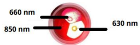
Figuur 2: Verschillende golflengten

Onze low level laser heeft 3 verschillende golflengtes. Te weten: 630nm, 660nm en 850nm. De golflengten van rood licht die de meest wetenschappelijk bewezen voordelen hebben, zijn 630 nm en 660 nm. De infraroodgolflengte waarvan wetenschappelijk is bewezen dat deze voordelen oplevert voor mensen, is de golflengte 850 nm. De rode golflengte van 630 nm geeft enorme cellulaire voordelen in het bovenste huidgebied. Deze golflengte is zeer geschikt bij huidaandoeningen. Rood licht dat wordt uitgezonden met een golflengte van 660 nm, wordt geabsorbeerd in de huidlagen en weefselstimulerende trigger- en acupunctuurpunten. Deze golflengte is het beste voor de behandeling van wonden en infecties. Het licht dat wordt uitgezonden op 850 nm wordt Nabij infra-rood genoemd. Dit licht is niet zichtbaar voor menselijke ogen. Nabij-infrarood licht dringt dieper door in het lichaam en wordt gebruikt voor de behandeling van spieren, pezen, banden, botten en gewrichten.