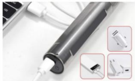
Figuur 4: Low level laser opladen

Als de low level laser niet normaal kan worden ingeschakeld, moet u deze opladen. Elk pakket wordt geleverd met een USB-kabel. Laad de low level laser op met de kabel die in de verpakking zit. Het indicatielampje knippert rood, wat betekent dat het begint met opladen, als het groen wordt, is de batterij volledig opgeladen en kun je weer van de therapietijd genieten.