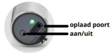
Figuur 3: Instructies

Houd de low level laser vast en klik op de aan/uitsleutelschakelaar en hij begint te werken. Er zit een timer van 5 minuten op, wanneer de tijd om is, wordt deze automatisch uitgeschakeld.